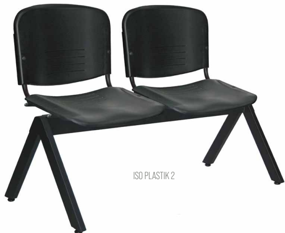
ISO PLASTIK 2