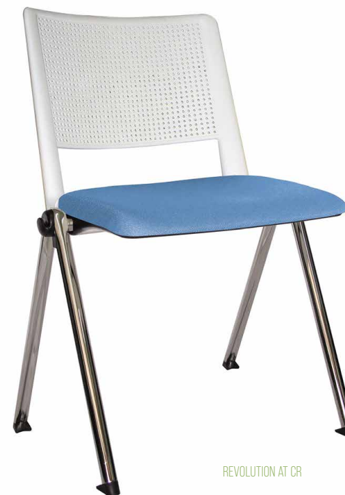
REVOLUTION AT CR