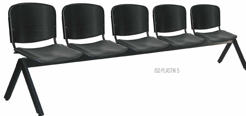
ISO PLASTIK 5

5 PLAZAS: 285cm de frente X 56cm de profundidad X 89cm de altura.