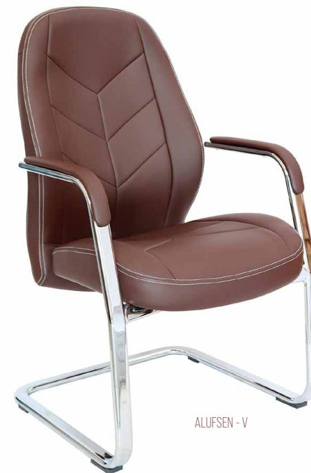
ALUFSEN - V

Descansa-brazos de aluminio pulido con pad de poliuretano inyectado.