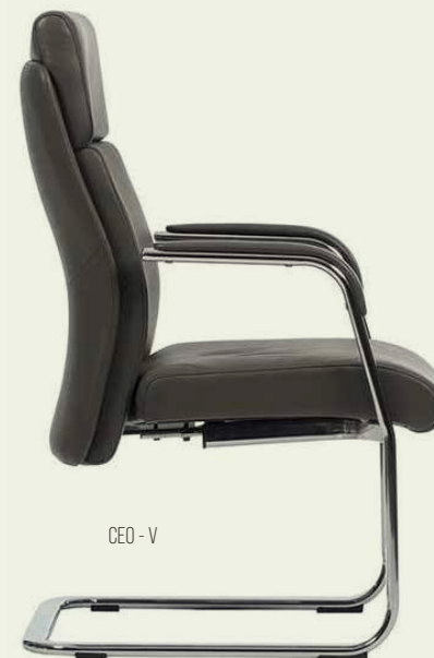
CEO - V