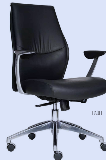
PAOLI - B