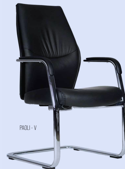
PAOLI - V

Descansa-brazos de aluminio pulido con pad de poliuretano inyectado.