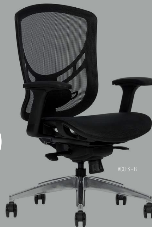
ACCES - B