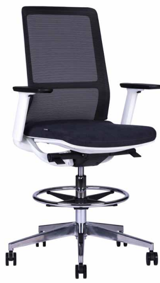
SENSE BL A