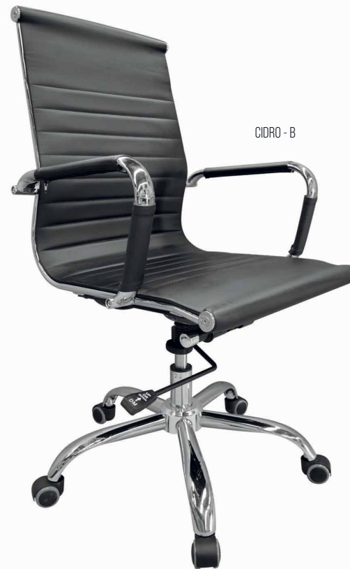
CIDRO - B

Descansa-brazos de acero cromado. Con funda en technoleather color negro.