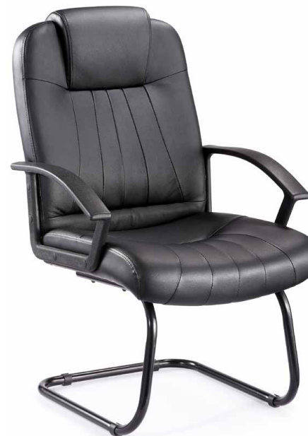
PABLO - V