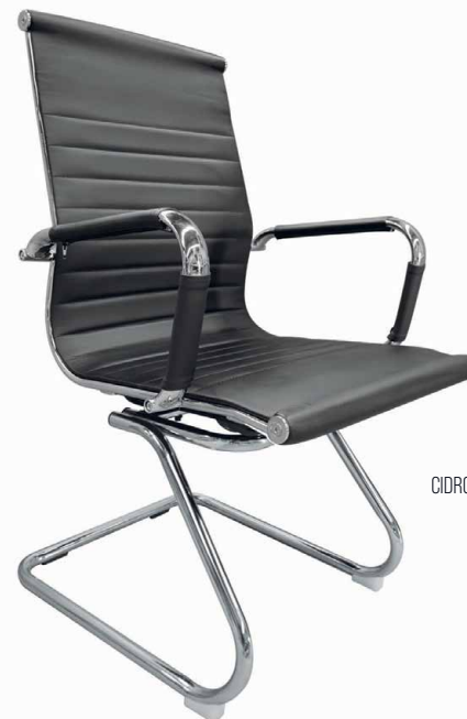
CIDRO - V