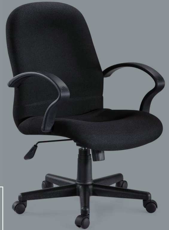
VALENTINA - B