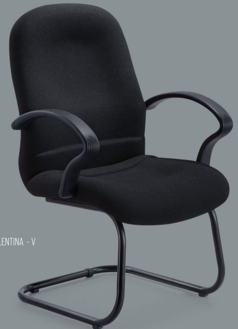
VALENTINA - V