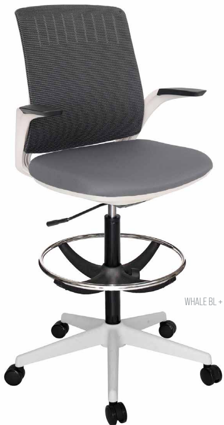
WHALE BL + RN