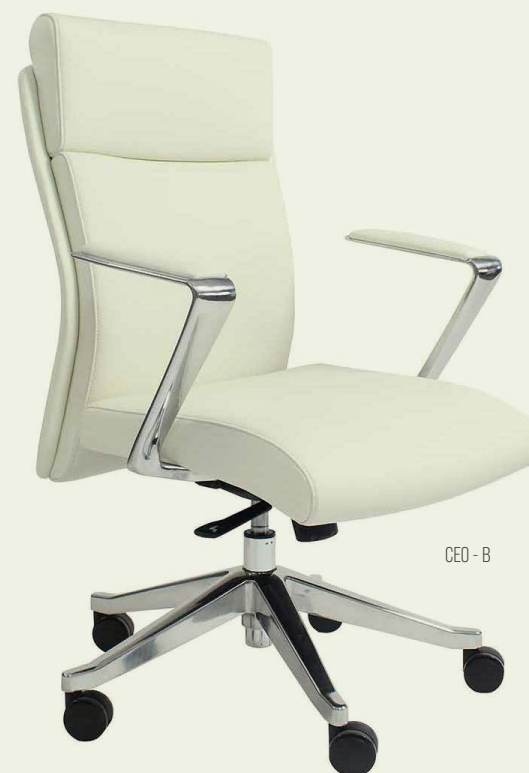
CEO - B