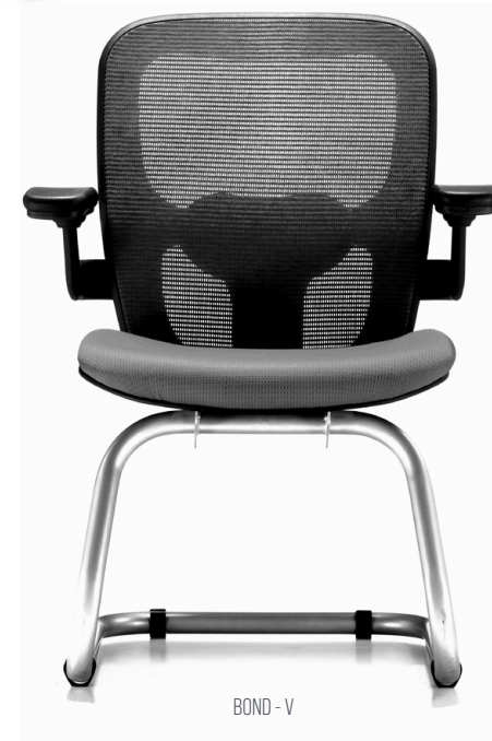
BOND - V

Descansa-brazos de polipropileno color negro con pad de poliuretano color negro.