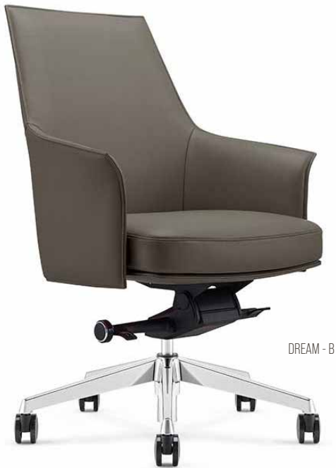
DREAM - B