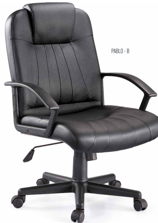
PABLO - B