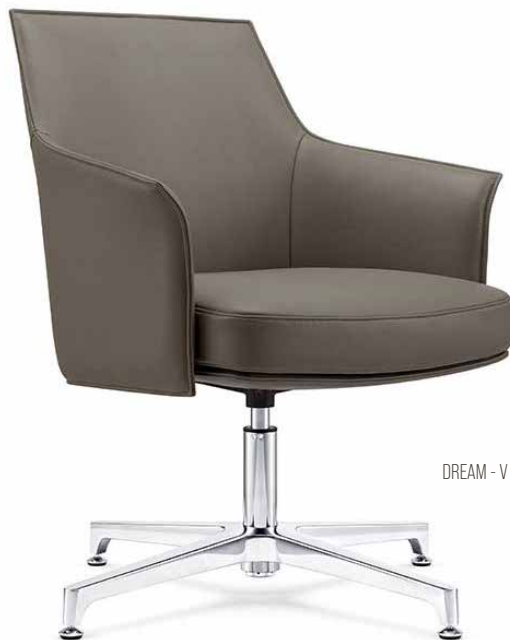
DREAM - V