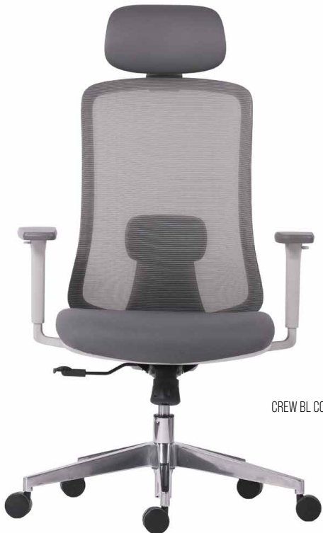
CREW BL CC